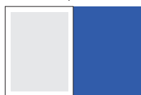
обложка, 1/1 полосы